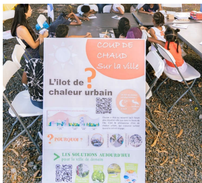
Des ateliers de sensibilisation

Un guide des bonnes pratiques "Lutte contre les îlots de chaleur urbains tropicaux" a été réalisé et diffusé dans le cadre du programme de rénovation urbain Nord Est Littoral (PRUNEL). Des sessions de formation-sensibilisation ont également été proposées aux services de la ville ainsi qu'aux intervenants locaux.